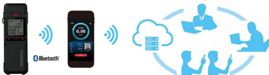
<データ連携のイメージ>