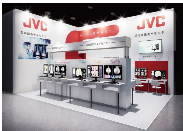
<当社ブースイメージ>

本ブースでは、USB Type-C（DisplayPort Alternate Mode）に対応した、21.3型300万画素カラー液晶モニター“i3シリーズ”「CL-S301」の参考出品をはじめ、大画面モデルや標準モデルなど、医用画像表示モニターのフルラインアップを展示。今後の普及が想定される遠隔・在宅読影やAI時代に対応するソリューションを実演・提案します。