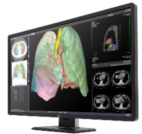
< 「CL-R813」 >

コストパフォーマンスと実用性を兼ね備えた、電子カルテ/モダリティ向け医用画像表示モニターの「CL-R813」を展示します。32型のワイドな画面領域により、CT・MRI・CR/DRなどの画像の同時表示に対応し、1画面にビューワ、レポート、AI判定結果などのさまざまなアプリケーションウィンドウの自由なレイアウトも可能。医用画像表示に求められるDICOM Part14階調カーブにも準拠します。また、狭ベゼルの採用と軽量設計によるスリムなデザインを実現し、机上にゆとりある作業空間を提供します。