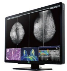
< 「CL-S1200」 >

業界最高水準※の1200万画素のワイド大画面を実現したマンモグラフィ向け医用画像表示モニターの「CL-S1200」を展示します。マンモグラフィ画像の二画面表示をはじめ、CT・MRI・超音波・病理などの画像の同時表示に対応。自由なウィンドウレイアウトが可能のため、さまざまな医用画像やAI解析結果などを1台で効率よく表示でき、読影作業の効率化や負担軽減、スペースの有効活用に貢献します。また、AIの学習のために大量の教師データの作成が必要な医用画像AIソフトウェアの開発においても、大画面・高画質表示により、長時間かつ集中力を要する医師の作業をサポートします。