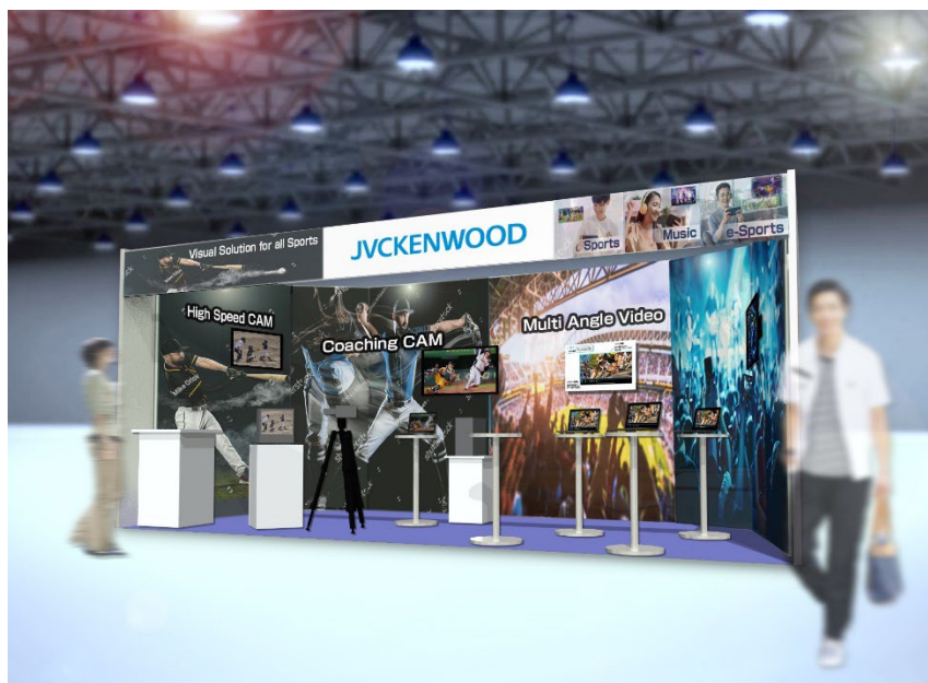
<当社ブースイメージ>

当社ブースでは、多視点映像によりアスリートのバイオメカニクスの分析や改善をサポートする「スポーツ映像コーチング」の体験エリアを設置します。また、近年、スポーツの中継配信やエンターテインメント市場で注目を集めている、異なるカメラでさまざまなアングルから撮影した複数の映像を同時に再生・配信するマルチアングル配信サービスとして、当社が独自に開発中の「yourLIVE」を参考出品します。