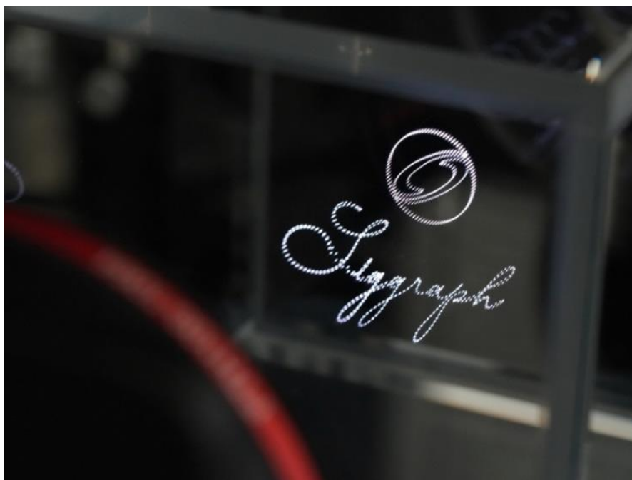
図1 本システムで描画された SIGGRAPH の文字とロゴマーク。