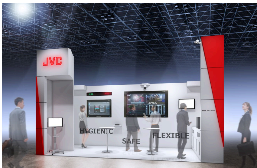
<当社ブースイメージ>

また、小型で機動性に優れたカートタイプの手術関連映像の記録システムや、最大8台までの映像信号を光IPネットワークで管理するシステムも参考出品します。