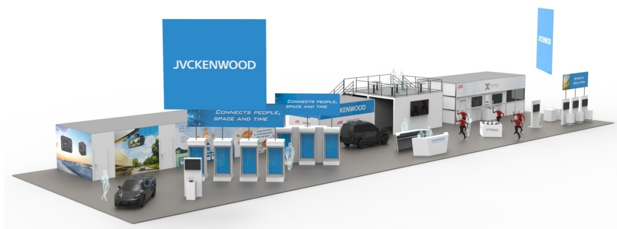
<当社ブースイメージ>

カーエレクトロニクスでは、Apple CarPlay/Android Auto™のワイヤレス接続に対応した新商品などを展示。オーディオ・ビジュアルでは、「CONNECTED CAM STUDIO」を核とした撮影から放送/配信までの IP 映像制作ソリューションや Bluetooth®に対応したスポーツ向けヘッドホン「AE」シリーズ新商品の試聴展示などスポーツ分野におけるソリューションを提案します。